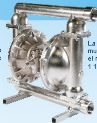
La fotografía muestra el modelo de 1 1/2"