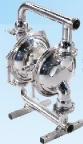
La fotografía muestra el modelo de 2"

En bombas Blagdon trabajamos siempre en estrecha colaboración con nuestros clientes para ofrecer la solución más eficiente y efectiva a las aplicaciones de bombeo de productos. Siempre con la intención de minimizar las interrupciones y el tiempo de parada, para mantener los mínimos costes para el cliente.